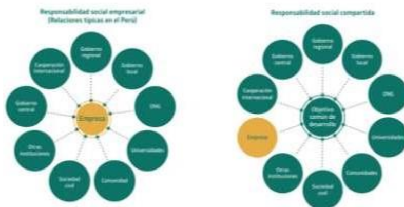
Cuadro 3. De responsabilidad social empresarial a responsabilidad social compartida

Este enfoque que viene desde el empresariado deja atrás el modelo en el que todos dependen de la empresa para el desarrollo y bienestar de la sociedad. En otras palabras, la empresa deja de ser el centro de la Responsabilidad Social y su lugar es tomado por el “objetivo común de desarrollo” (Cuadro 3). En este nuevo esquema, el gobierno, las empresas y las comunidades cumplen su rol de mantener un diálogo constructivo, tal como recomiendan la OCDE y la OIT.